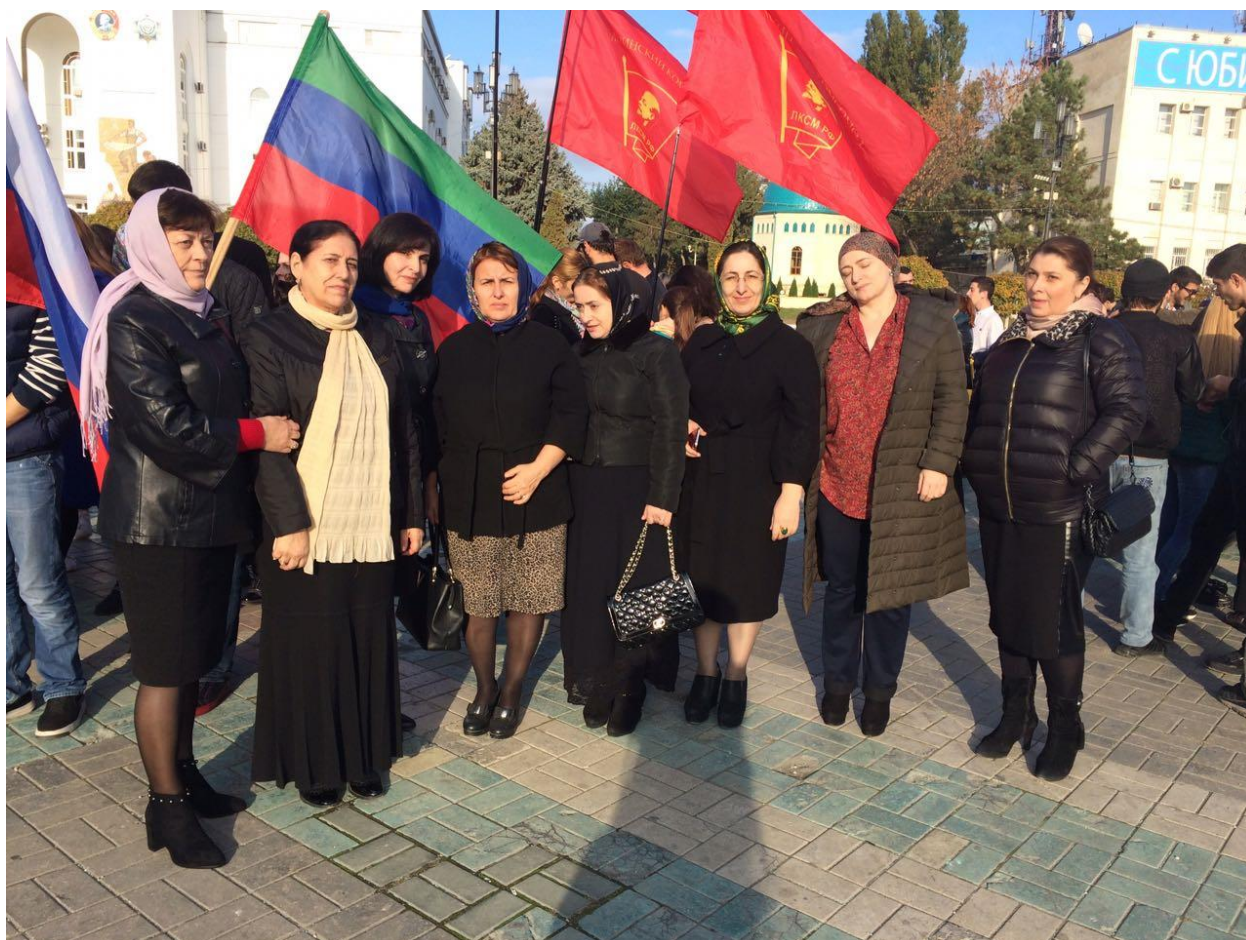
Митинг . 4 ноября- День единства .